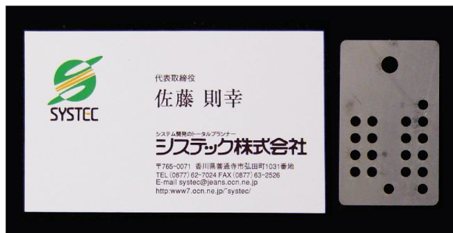
名刺と比較。かなりコンパクト!!